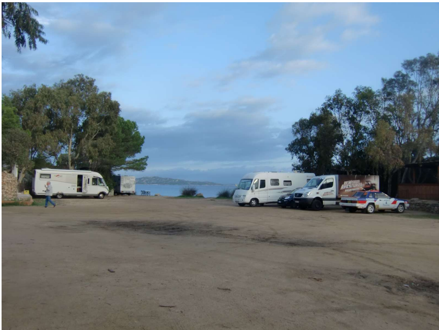
23/10/16 Palau davvero un ultimo sguardo malinconico al camping che ci ha ospitati per 4 splendidi giorni.