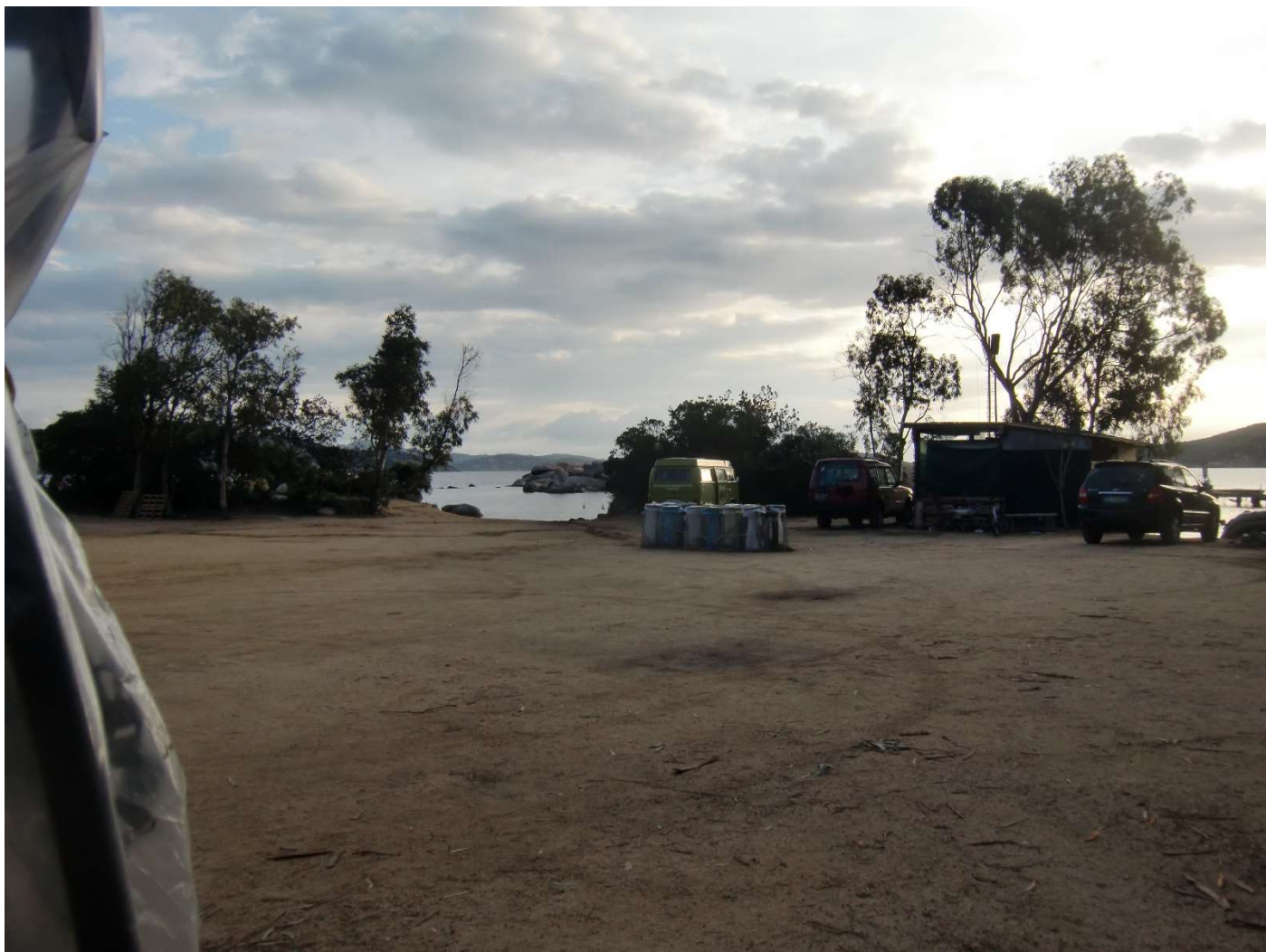
23/10/16 Palau Camping Baia Saraceno